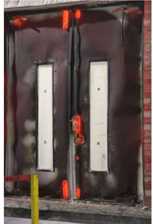
Ensayo de Puertas Resistentes al Fuego.

La Ordenanza General de Urbanismo y Construcciones establece para puertas resistencias al fuego de 30 a 60 minutos, mientras que el Reglamento de Almacenamiento de Sustancias Peligrosas, indica que en estas bodegas las puertas de escape y las de carga y descarga deben tener una resistencia al fuego no inferior al 75% de la de los muros que las contienen.