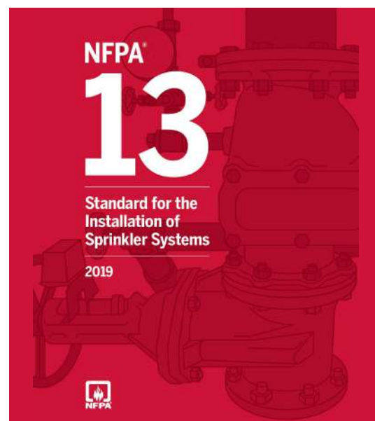
Edición Vigente NFPA 13 (2019).