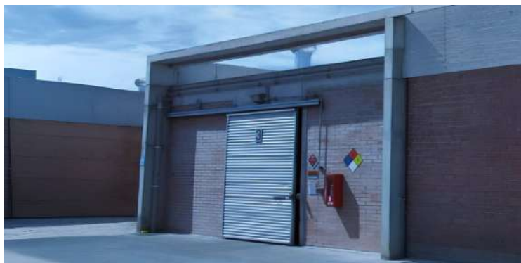
Muro cortafuego en bodega de sustancias peligrosas

Los muros cortafuegos son elementos clave en la protección pasiva contra incendios, garantizando la seguridad de las personas y minimizando daños materiales. Comprender su función y diferencias con los muros divisorios es esencial para aplicar correctamente las normativas y priorizar la seguridad contra incendios.