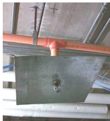
Figura 2: “Colector de Calor” en rociador iii