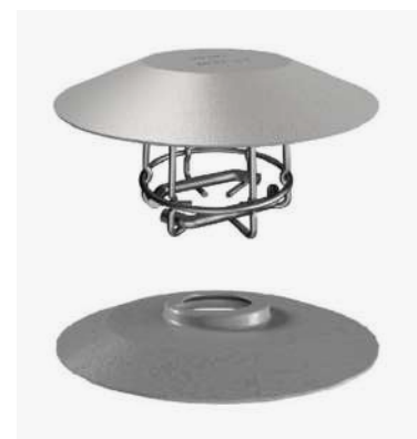
Figura 3: Escudos contra agua certificados iv