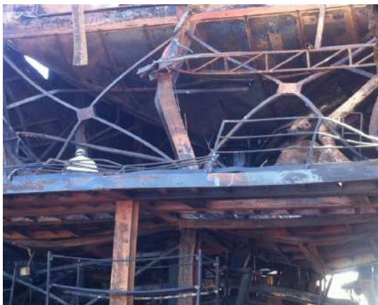
Estructura sometida a incendio real.

Los parámetros de respuesta generados a partir del análisis térmico y estructural pueden ser utilizados para chequear la estabilidad o integridad de un miembro estructural, por ejemplo, falla por deformaciones térmicas o reducción de la resistencia y rigidez de los materiales (en acero y/o hormigón).