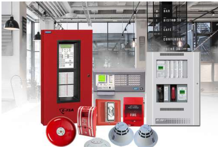
Sistemas de Detección / Notificación / Alarma de Incendio.

Es importante advertir que paneles o centrales de robo e intrusión pueden contar con certificación de UL, pero este corresponde al cumplimiento de la norma UL 985 que se refiere a unidades de sistemas residenciales de advertencia de incendios. Así, este tipo de paneles no es apropiado para edificios mayores, pero es frecuente encontrarlos instalados en edificios de altura, industriales, bodegas, entre otros usos, debido principalmente al desconocimiento de sus limitaciones y a la carencia de guías técnicas nacionales que colaboren en la definición del tipo de sistema de detección y alarma que una edificación necesita.